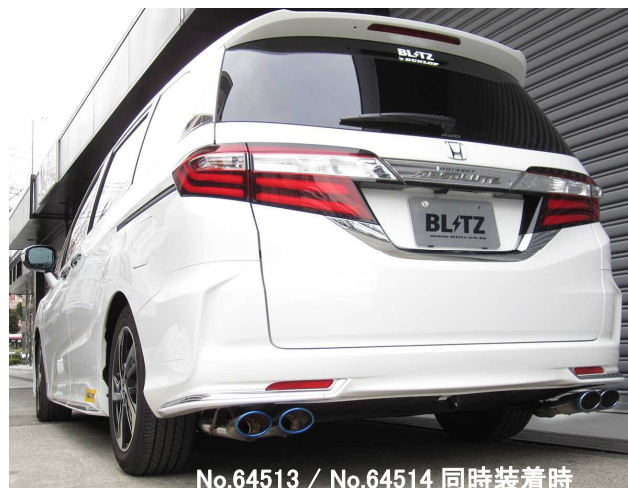
No.64513 / No.64514 同時装着時