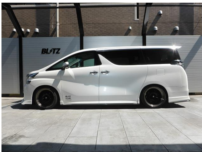
フロント:-55mm ダウン / リア:-70 mmダウン