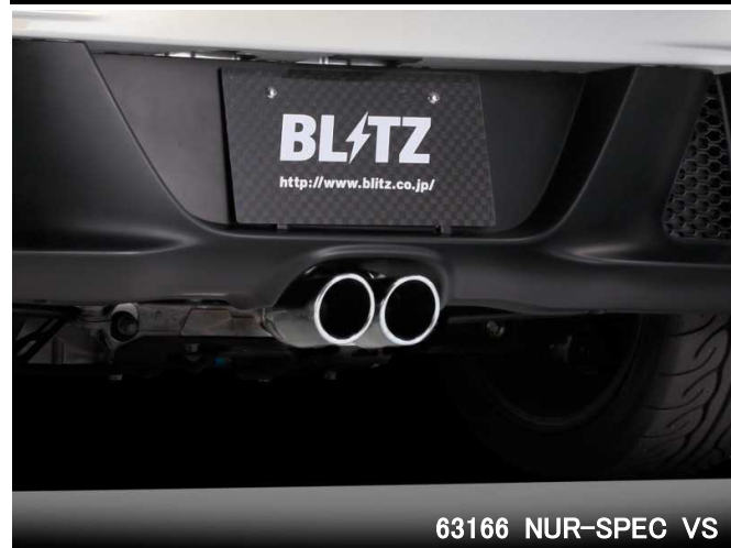
63166 NUR-SPEC VS

※1: マフラー地上高について エキゾーストシステム装着時、交換部分と路面とのクリアランスが一番小さい部分を記載しています。基本的には、ノーマル車高時のデータを記載していますが、車両個体差のため記載データと異なる場合があります。予めご了承下さい。