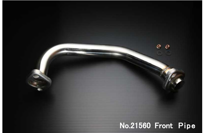
No.21560 Front Pipe