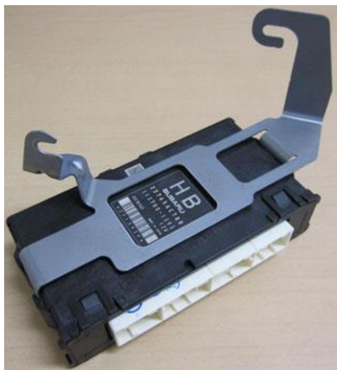
純正 ECU 取り外し後