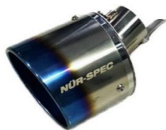
フィニッシャー-VSR本体