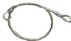
落下防止用ワイヤー