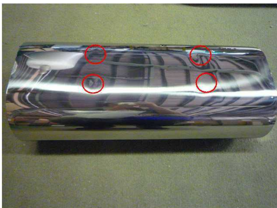
サイレンサー全体図

メインサイレンサーの外観に下記画像(丸印)のような、溶接による多少の歪みが見受けられる場合がございますが、これはサイレンサー内部の溶接工程の際に発生するひずみによるもので異常ではございませんので、予めご了承いただけますようお願い致します。