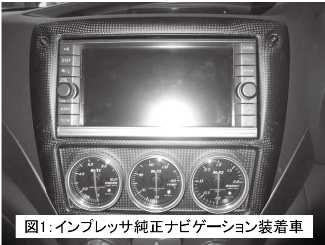
図1:インプレッサ純正ナビゲーション装着車