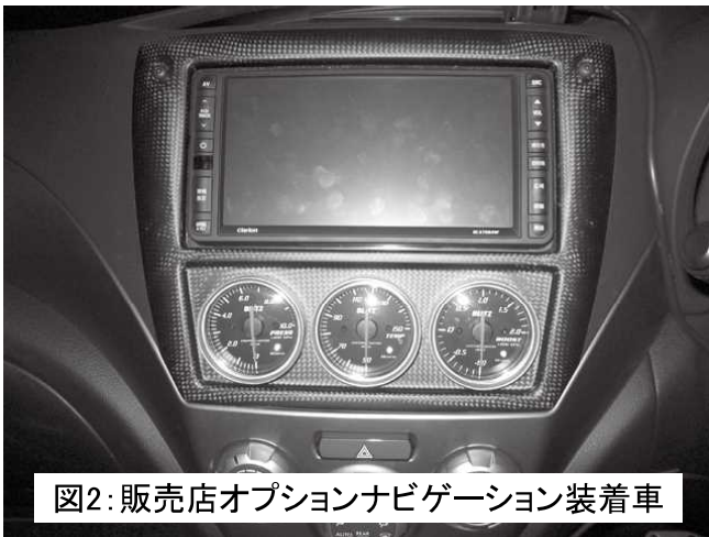
図2:販売店オプションナビゲーション装着車