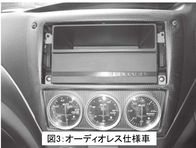
図3:オーディオレス仕様車

※ 19167(φ52 3連パネル)のオーディオ部分開口部の大きさはワイド2DINサイズで開けております。