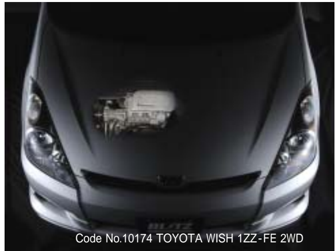
Code No.10174 TOYOTA WISH 1ZZ-FE 2WD