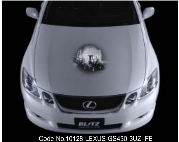
Code No.10128 LEXUS GS430 3UZ-FE