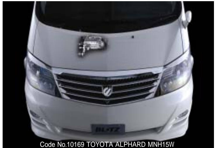
Code No.10169 TOYOTA ALPHARD MNH15W