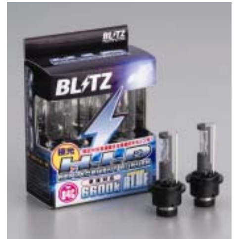
パッケージデザインイメージ

1 車検場によっては、検査機器の備えが無く検査官の目視判断によることがあるため必ずしも車検に通らない場合がございますので、ご了承ください。