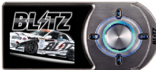
15147 : R-VIT i-Color FLASH Ver2.1 METAL BLACK