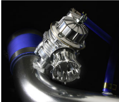
リリースタイプイメージ