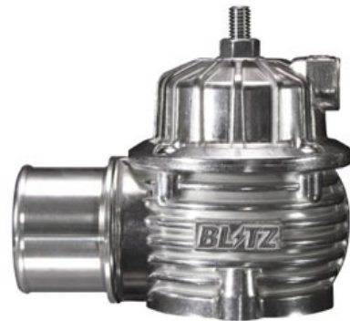
リターンタイプイメージ