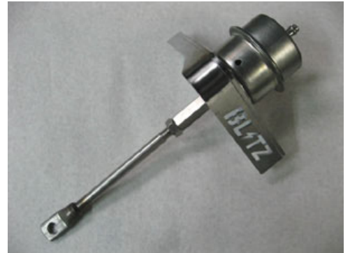
21320:強化アクチュエーター C24A