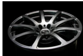
BRW Profile 09MAG