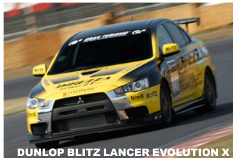
DUNLOP BLITZ LANCER EVOLUTION X