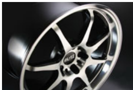
BRW Profile 08F