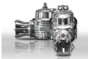
SUPER SOUND BLOW OFF VALVE VD