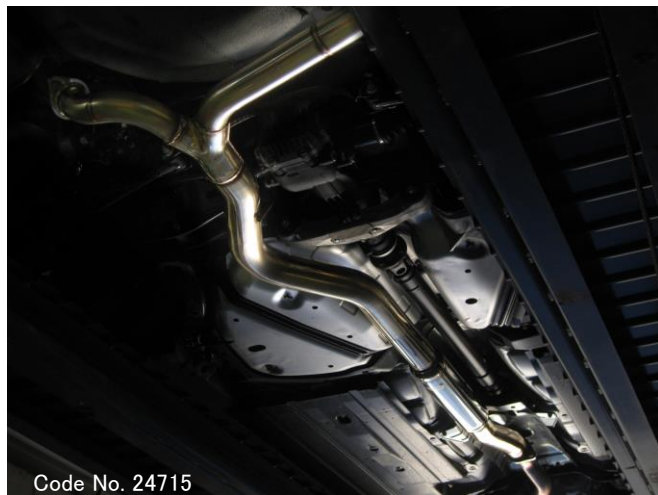
Code No. 24715

NUR-SPEC シリーズと併用で 92dB、純正マフラーと併用で 84 dB。