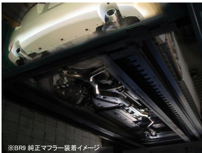
※BR9 純正マフラー装着イメージ