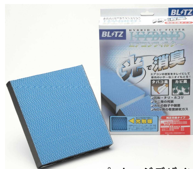
パッケージデザインイメージ