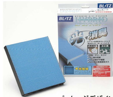
パッケージデザインイメージ