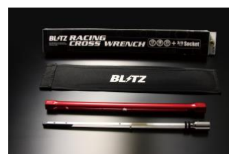
13959 : BLITZ RACING CROSS WRENCH