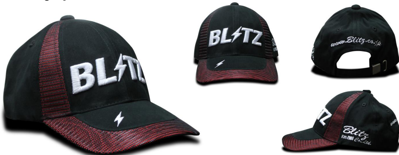
13964 : BLITZ Racing Cap Black/Red