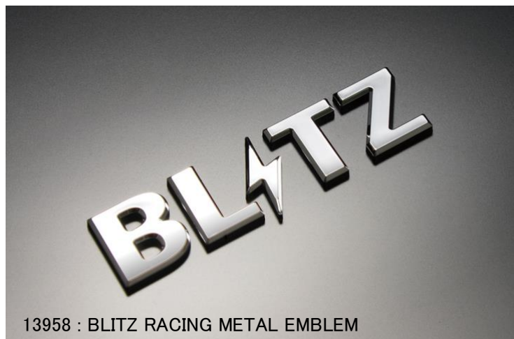
13958 : BLITZ RACING METAL EMBLEM