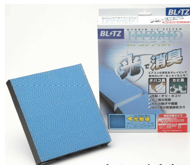
パッケージデザインイメージ