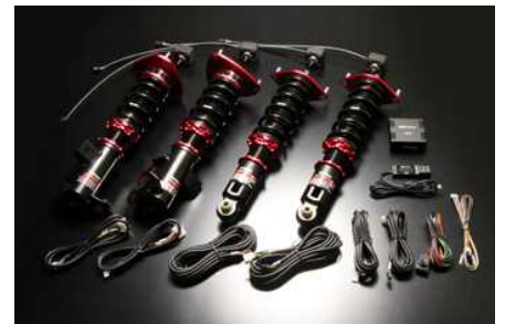
DAMPER ZZ-R SpecDSC 86/BRZ