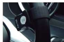
ワイヤレスリモートスイッチ(別売)

スクランブルスイッチ(別売)により、手元から簡単にモードを切り替える事ができます。