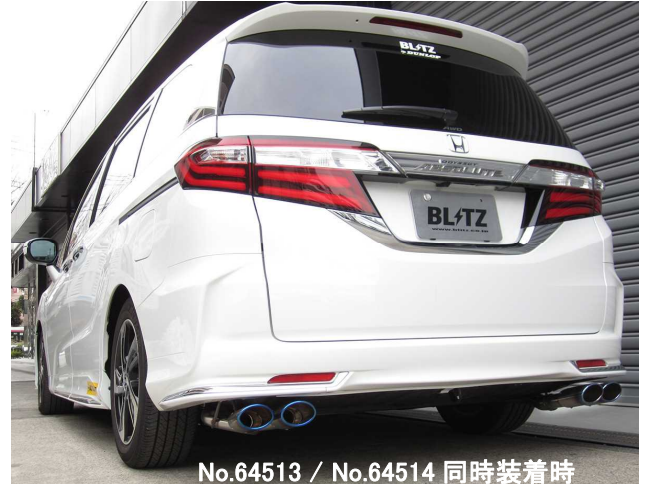
No.64513 / No.64514 同時装着時