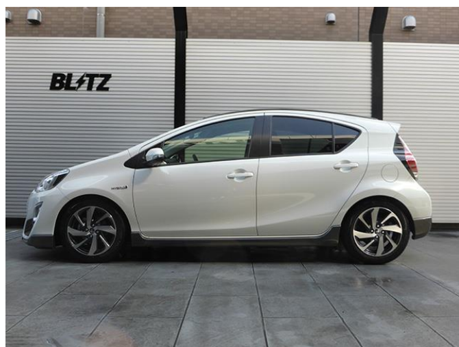
フロント:-53mm ダウン / リア:-33 mmダウン