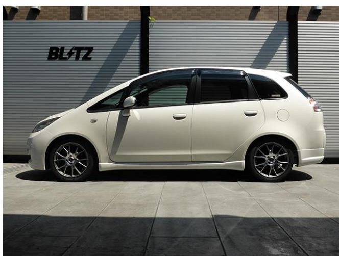
フロント:-35mmダウン / リア:-22mmダウン