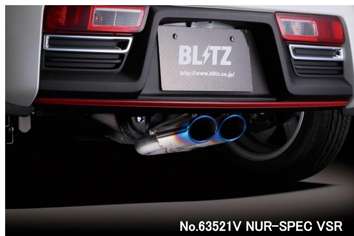
No.63521V NUR-SPEC VSR

※1: マフラー地上高について エキゾーストシステム装着時、交換部分と路面とのクリアランス が一番小さい部分を記載しています。基本的には、ノーマル車 高時のデータを記載していますが、車両個体差のため記載デー タと異なる場合があります。予めご了承下さい。