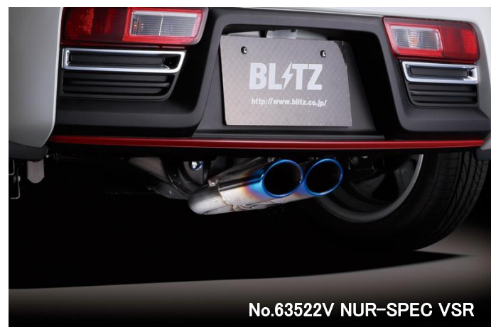
No.63522V NUR-SPEC VSR

※1: マフラー地上高について エキゾーストシステム装着時、交換部分と路面とのクリアランス が一番小さい部分を記載しています。基本的には、ノーマル車 高時のデータを記載していますが、車両個体差のため記載デー タと異なる場合があります。予めご了承ください。