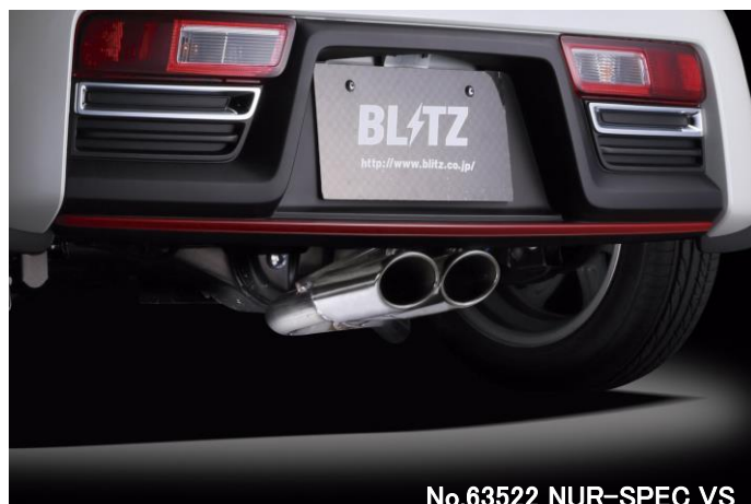
No.63522 NUR-SPEC VS

※1: マフラー地上高について エキゾーストシステム装着時、交換部分と路面とのクリアランス が一番小さい部分を記載しています。基本的には、ノーマル車 高時のデータを記載していますが、車両個体差のため記載デ ータと異なる場合があります。予めご了承下さい。