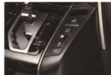
3 スイッチ本体のみ