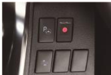
1 スイッチ本体+ サービスパネルアダプター