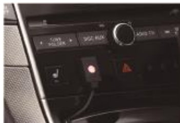
2 スイッチ本体+アダプター