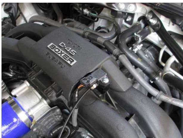
樹脂製マニホールド 取り付け状態 (M/C 前)