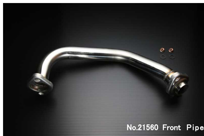
No.21560 Front Pipe