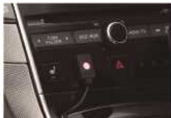
2 スイッチ本体+アダプター