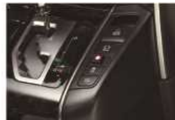
3 スイッチ本体のみ