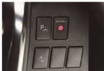
1 スイッチ本体+ サービスパネルアダプター