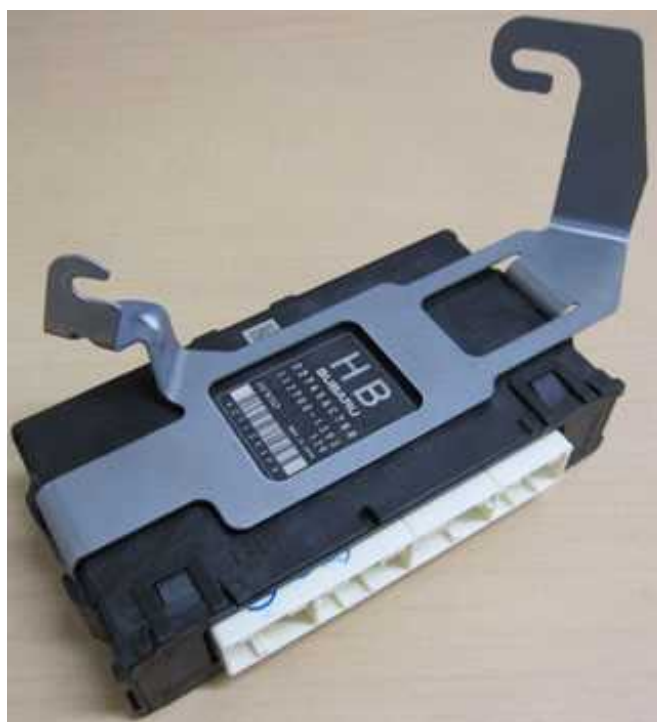
純正 ECU 取り外し後