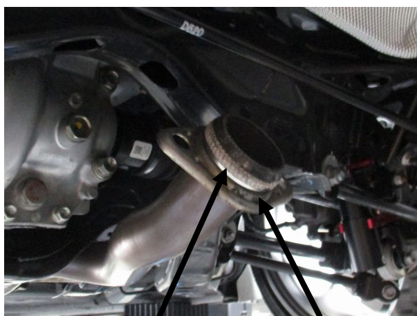
純正球形ガスケット