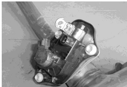
エキゾーストパイプガスコントロールアクチュエータ

2) 外した純正マフラーからエキゾーストパイプガスコントロールアクチュエータ 2個を移植してください。アクチュエーターの差込み部分をニルスペックマフラーのバルブ部切欠きに差し込んだ後、少し回転させた状態で固定します。固定には M8 ボルト 6 個と M8 ナット 6 個を使用下さい。