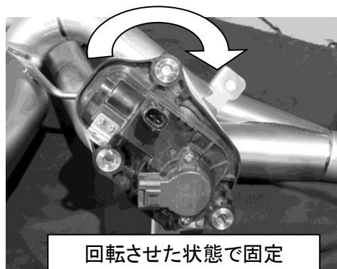
回転させた状態で固定

3) マフラーを装着してからエキゾーストパイプガスコントロールアクチュエータのカプラー4個を接続してください。