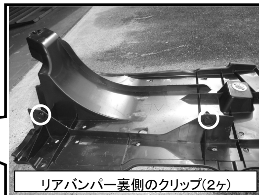
リアバンパー裏側のクリップ(2ヶ)