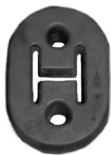
マフラーブッシュ