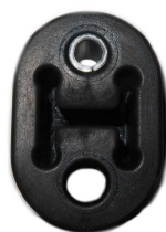
カラー入りマフラーブッシュ

3) 写真のように助手席側ボディのサービスホール(上側)を使用して、付属のカラー入りマフラーブッシュを M8 ボルト・ナット・ワッシャーで取り付けてください。ブッシュはボディの外側に止めてください。サービスホールがシーラントで埋まっている場合はドライバーなどで穴を開けてください。