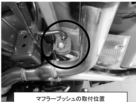
マフラーブッシュの取付位置

3) 写真のように助手席側ボディのサービスホール(上側)を使用して、付属のカラー入りマフラーブッシュを M8 ボルト・ナット・ワッシャーで取り付けてください。ブッシュはボディの外側に止めてください。サービスホールがシーラントで埋まっている場合はドライバーなどで穴を開けてください。