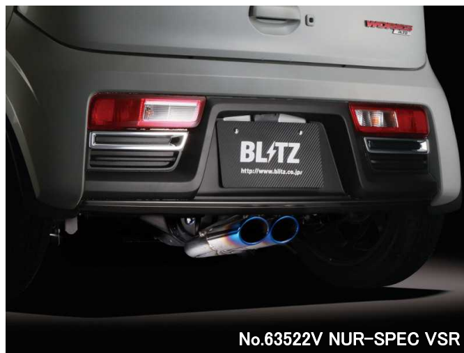
No.63522V NUR-SPEC VSR