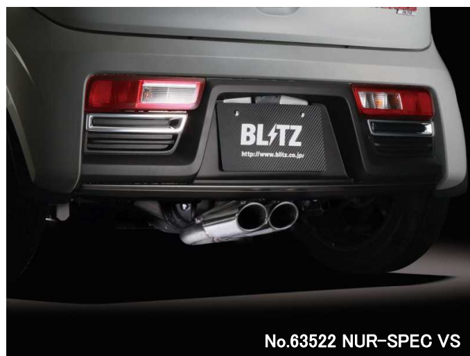
No.63522 NUR-SPEC VS

※1:マフラー地上高について エキゾーストシステム装着時、交換部分と路面とのクリアランス が一番小さい部分を記載しています。基本的には、ノーマル車 高時のデータを記載していますが、車両個体差のため記載デー タと異なる場合があります。予めご了承下さい。