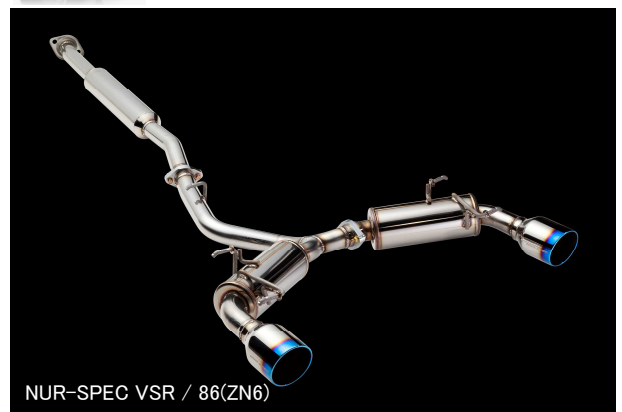
NUR-SPEC VSR / 86(ZN6)