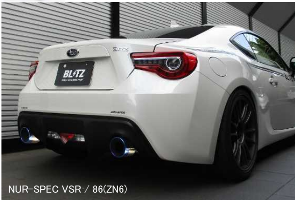
NUR-SPEC VSR / 86(ZN6)