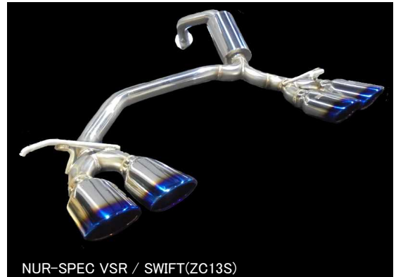
NÜR-SPEC VS / SWIFT(ZC13S)