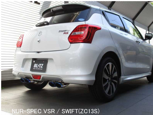
NÜR-SPEC VSR / SWIFT(ZC13S)