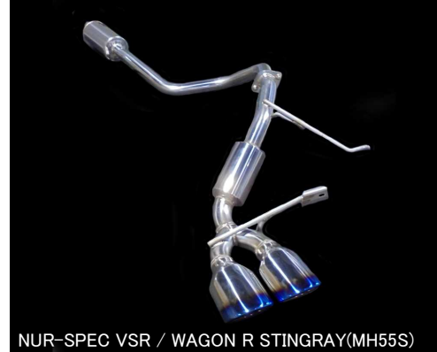
NÜR-SPEC VS / WAGON R STINGRAY(MH55S)