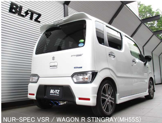
NÜR-SPEC VSR / WAGON R STINGRAY(MH55S)