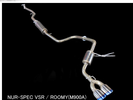
NÜR-SPEC VS / ROOMY(M900A)