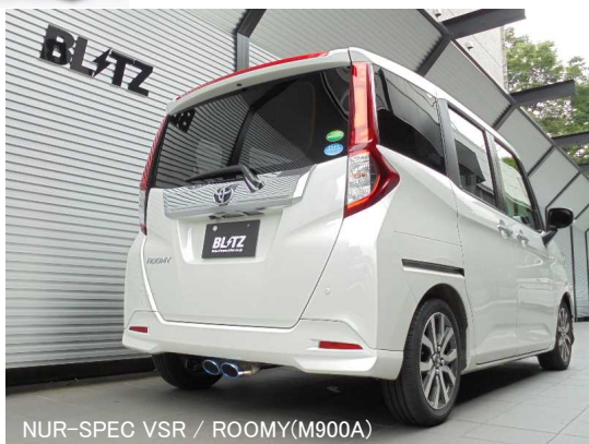
NÜR-SPEC VSR / ROOMY(M900A)