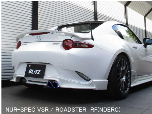
NÜR-SPEC VSR / ROADSTER RF(NDERC)