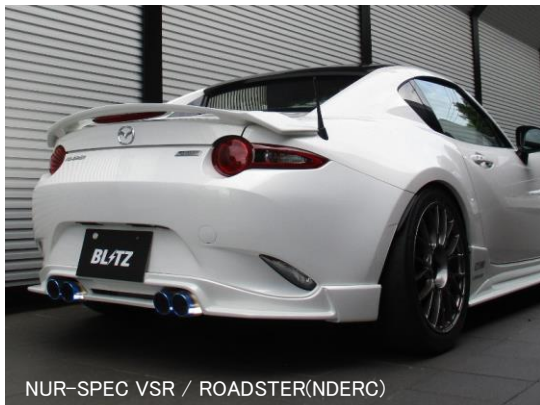
NÜR-SPEC VSR / ROADSTER(NDCRC)