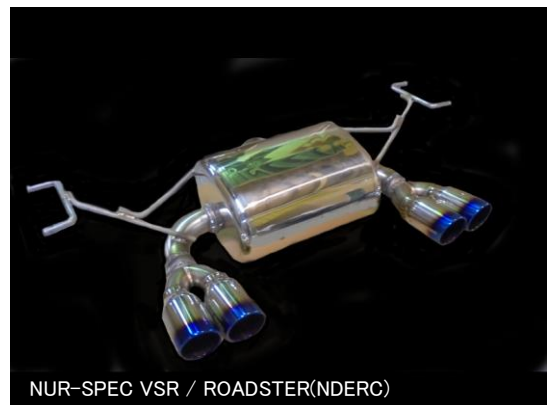
NÜR-SPEC VSR / ROADSTER(NDCRC)