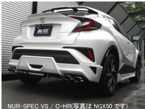
NÜR-SPEC VS / C-HR(写真は NGX50 です)