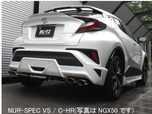
NÜR-SPEC VS / C-HR(写真は NGX50 です)