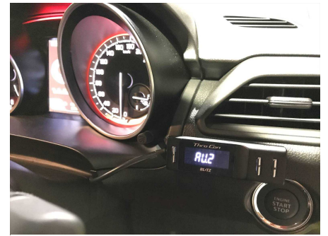
シビックハッチバック装着例