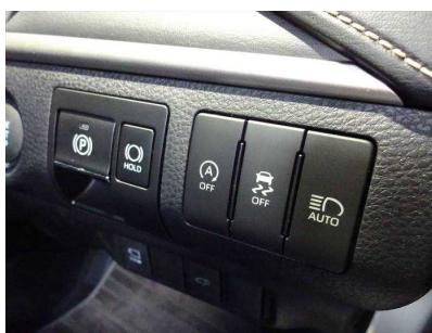
TOYOTA ハリアー アイドリングストップ