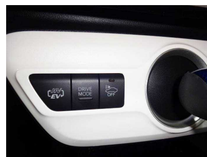
TOYOTA PRIUS PHV DRIVE MODE