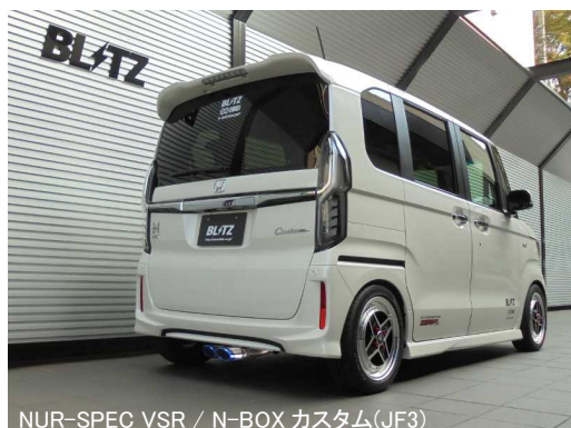
NÜR-SPEC VSR / N-BOX カスタム(JF3)