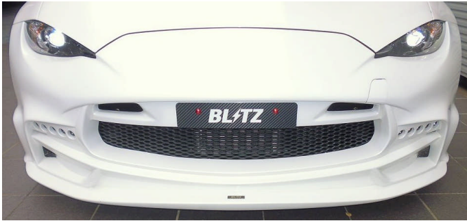
弊社フロントバンパー同時装着例