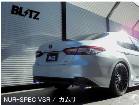
NÜR-SPEC VSR / カムリ