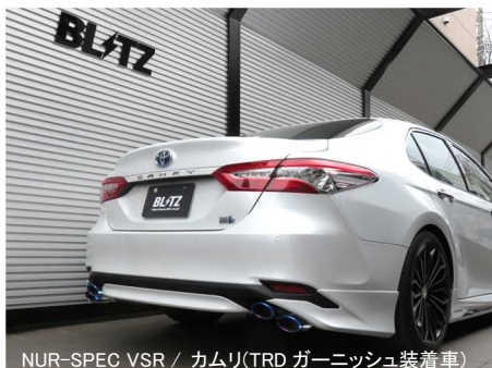
NÜR-SPEC VSR / カムリ(TRD ガーニッシュ装着車)