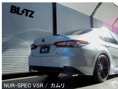
NÜR-SPEC VSR / カムリ