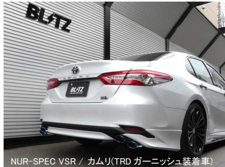
NÜR-SPEC VSR / カムリ(TRD ガーニッシュ装着車)