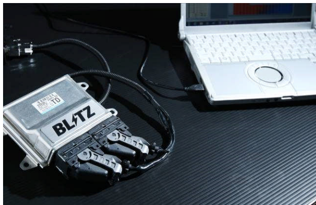
BLITZ TUNING ECU