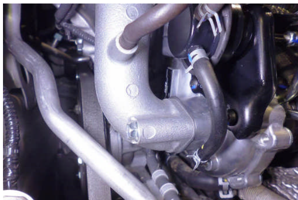
2940ALT-100R タービン 車両装着状態